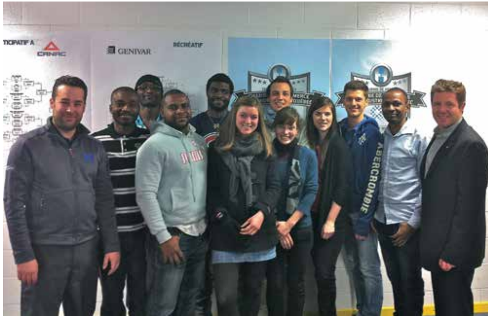
Les étudiants participant au Parcours Intégration ont été bénévoles à la 1 re édition du Tournoi de hockey de la Chambre de commerce et d'industrie de Québec en février dernier.