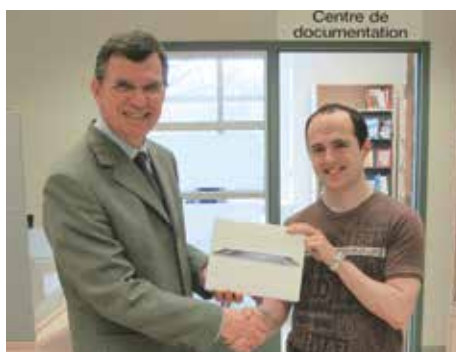
Les gagnants du concours « Crée ton CV Web » lancé sur Facebook à l'automne 2012. Un iPad et deux chèques-cadeaux de 100 $ chez Laurier Québec ont été tirés.