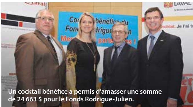
Un cocktail bénéfique a permis d'amasser une somme de 24 663 $ pour le Fonds Rodrigue-Julien.