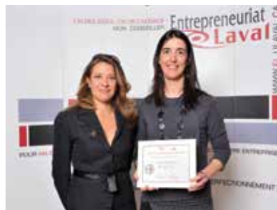
Réceptiendaires des bourses du Fonds Rodrigue-Julien remises lors du Concours québécois en entrepreneuriat d'Entrepreneuriat Laval.

ainsi qu'une séance de magasinage avec une styliste, d'une valeur de 300 $. Ainsi, le gagnant a pu dénicher la tenue vestimentaire parfaite pour une entrevue d'emploi.