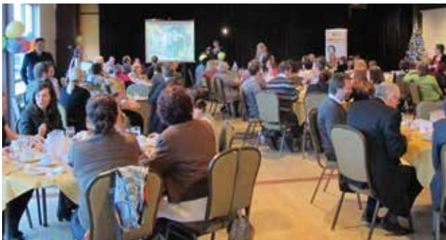
Lors du dîner retrouvailles, plus de 100 personnes se sont retrouvées autour d'un bon plat pour souligner les 20 ans du Service de placement !

Notons également le dîner retrouvailles organisé le 4 décembre dernier. Cette occasion a permis de réunir de nombreuses personnes, employés et collaborateurs, qui ont contribué au succès du SPLA au fil des ans. Réalisée au profit de Centraide, cette activité a généré près de 900 $. Une belle façon de célébrer en donnant au suivant !