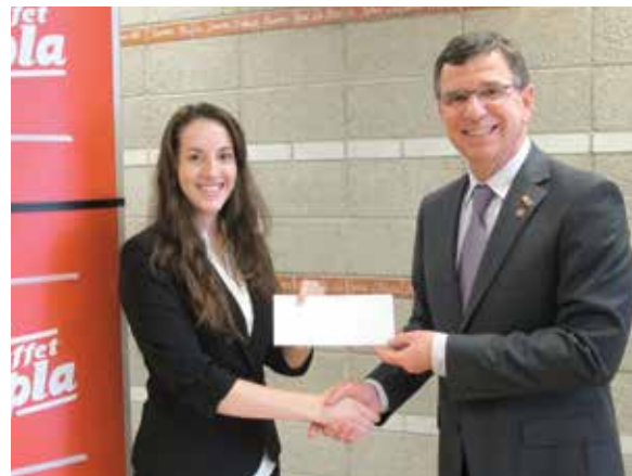
AIESEC Laval a remis au SPLA une contribution de 2 500 $ allouée au Fonds de soutien à l'emploi étudiant de la Fondation de l'Université Laval en raison de leur collaboration à l'organisation au Carrefour de l'emploi.