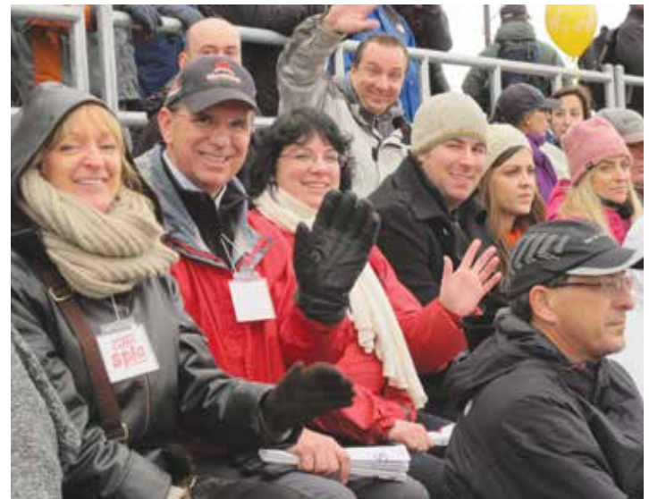
Des membres de l'équipe et des employeurs lors de la première partie des séries éliminatoires du Rouge et Or Football.

Enfin, les 20 ans du SPLA ont été soulignés lors du Toast à la réussite , une activité annuelle visant à remercier les employeurs de leur engagement envers les étudiants de l'Université Laval.