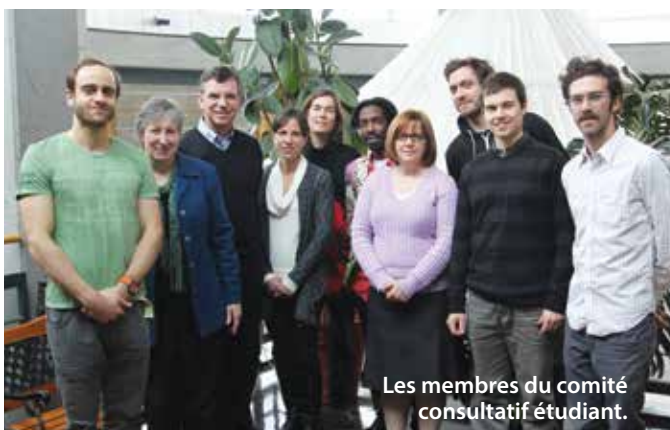
Les membres du comité consultatif étudiant.

Les rencontres menées dans le cadre de cette nouvelle initiative ont été enrichissantes pour tous. Le comité consultatif étudiant sera donc permanent et, chaque année, de nouvelles personnes pourront y participer.