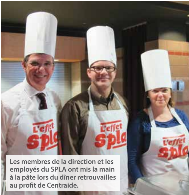
Les membres de la direction et les employés du SPLA ont mis la main à la pâte lors du dîner retrouvailles au profit de Centraide.