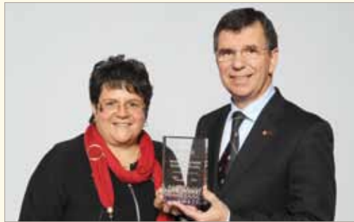
Lors du Gala reconnaissance « Un monde à faire, hommage à la diversité » de la Chambre de commerce et d'industrie de Québec, le SPLA a reçu le prix Entreprise du monde, intégration de la relève. Un prix dont toute l'équipe est fière!