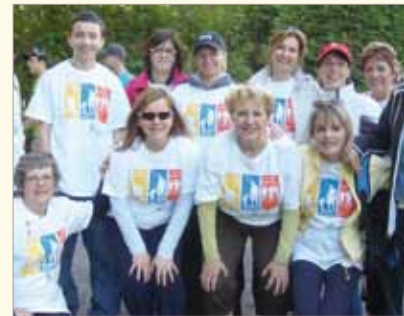
En juin 2011, des employés du SPLA ont participé, pour une 3 e année consécutive, au Relais pour la vie de la Société canadienne du cancer.

Mentionnons que plusieurs membres du personnel sont très engagés socialement. Chaque année, l'équipe contribue entre autres à Centraide, et ce, de multiples façons. En mai 2011, le SPLA a tenu une soirée-bénéfice « Épatez-nous don ! » lors de laquelle des membres du personnel ont mis leur talent à profit. La soirée a été une grande réussite et a permis d'amasser au-delà de 800 $. D'ailleurs, le SPLA a reçu, pour la 2 e année consécutive, la certification ARGENT pour sa contribution et son engagement.