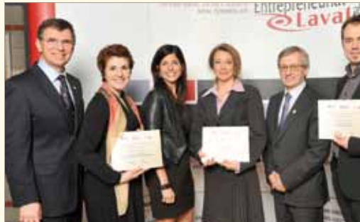
Bourses remises lors d'activités d'Entrepreneuriat Laval.

Le SPLA poursuit sa participation à plusieurs projets communs avec Entrepreneuriat Laval, notamment le programme Mentor, avec son volet entrepreneurial.