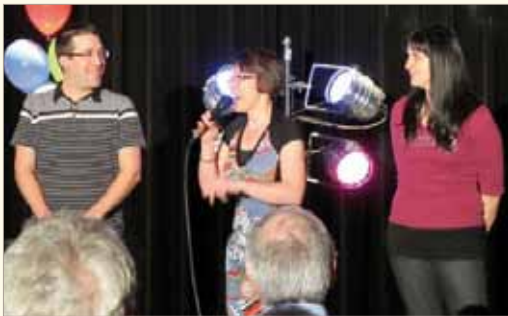
La soirée-bénéfice « Épatez-nous don » a permis d'amasser plus de 800 $ pour Centraide.

Mentionnons que plusieurs membres du personnel sont très engagés socialement. Chaque année, l'équipe contribue entre autres à Centraide, et ce, de multiples façons. En mai 2011, le SPLA a tenu une soirée-bénéfice « Épatez-nous don ! » lors de laquelle des membres du personnel ont mis leur talent à profit. La soirée fut une grande réussite et a permis d'amasser au-delà de 800 $. D'ailleurs, le SPLA a reçu, pour la 2 e année consécutive, la certification ARGENT pour sa contribution et son engagement.