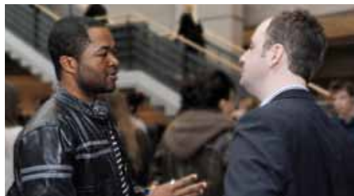
Lors de l'activité Opération rapprochement, une soixantaine d'étudiants étrangers ont pu rencontrer des employeurs de divers secteurs d'activité.

Les étudiants étrangers représentent plus de 10 % de la totalité des étudiants de l'Université Laval. Notre équipe est formée pour bien accompagner cette clientèle tout au long de ses études et lors de son passage au marché du travail. En mars 2012, la 2 e édition d'Opération rapprochement a eu lieu grâce, notamment, au soutien de la Chambre de commerce de Québec et de la Jeune Chambre de commerce de Québec. Cette rencontre a été l'occasion de favoriser l'intégration des étudiants étrangers au marché de l'emploi et à la communauté des affaires de la région de Québec. Plus de 130 étudiants et employeurs y ont participé.