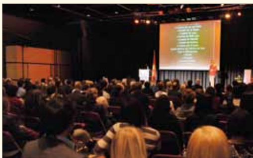
Plus de 200 personnes étaient présentes à la soirée reconnaissance Toast à la réussite 2012. Cet événement remporte toujours un franc succès auprès des employeurs.

Les employeurs bénéficient d'un nouvel outil leur permettant d'entrer en contact avec les étudiants aux cycles supérieurs en administration : le CV Web multimédia. Dorénavant, les employeurs ont accès à une banque de CV nouvelle génération dans le site Web du SPLA. Ils peuvent donc consulter différents profils et identifier des candidats répondant à leurs besoins en ressources humaines. Si ce projet pilote est concluant, l'outil pourrait être offert à d'autres programmes d'études.