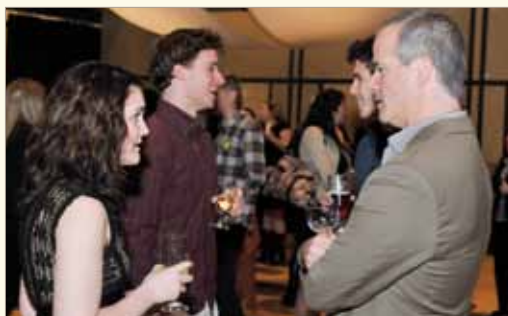
Le programme Mentor a formé 79 jumelages pour le volet socioprofessionnel, un record depuis les débuts du programme Mentor en 2005 !