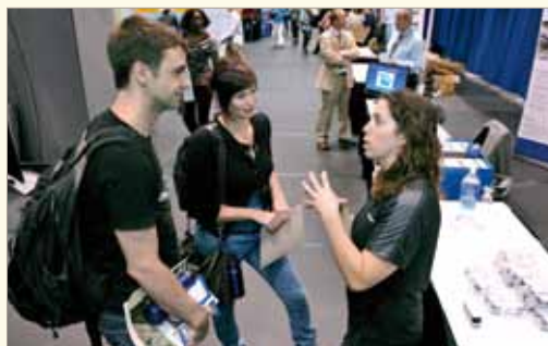
En 2011-2012, plus de 800 employeurs se sont déplacés sur le campus pour rencontrer des étudiants dans le cadre de journées carrière, de conférences ou d'autres activités de réseautage.