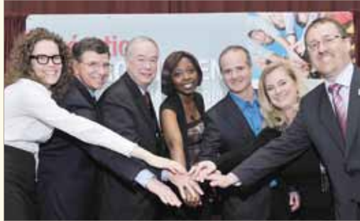
La 2 e édition d'Opération rapprochement a rassemblé plus de 130 étudiants étrangers et employeurs. Une véritable réussite !