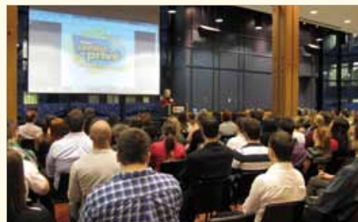
Les établissements d'enseignement secondaire privés de Québec et Chaudière-Appalaches ont tenu leur 5 à 7 annuel sur le campus, en février dernier. Près de 90 étudiants, soit un nombre record, ont participé à l'activité.