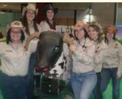
En février dernier se tenait la 1 re édition de la Semaine des régions. 15 régions du Québec étaient représentées sur le campus, dont la Mauricie.

Le SPLA poursuit la diffusion de son bulletin électronique, Info-SPLA, destiné aux employeurs. Plus de 10 000 contacts employeurs reçoivent ce bulletin mensuellement.