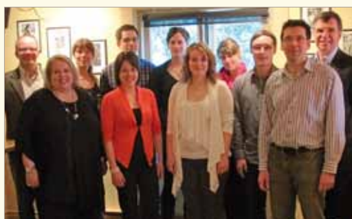
Huit stagiaires de la maîtrise en orientation ont pu mettre leurs connaissances en pratique en effectuant des consultations sans rendez-vous au SPLA.

Le Service de placement a mis en place un projet, avec la Clinique de counseling et d'orientation de l'Université Laval, qui a permis à huit stagiaires de la maîtrise en orientation d'effectuer des consultations sans rendez-vous au bureau principal du SPLA. Un projet qui a été fort apprécié par les stagiaires et par l'équipe de conseillers en emploi du SPLA.