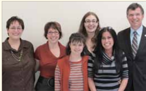
Deux employés du SPLA en compagnie de personnes impliquées pour Centraide.