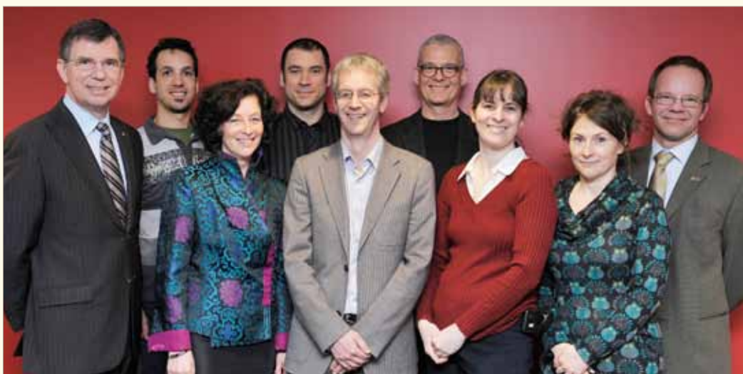
Le SPLA a collaboré avec la Bibliothèque et le Bureau des services pédagogiques afin d'offrir aux étudiants la formation en ligne Ta recherche d'emploi en un seul CLIC!

Une nouvelle formation en ligne sur la recherche d'emploi destinée aux étudiants et aux diplômés a été lancée au printemps 2011. La formation Ta recherche d'emploi en un seul CLIC ! est le fruit d'une collaboration entre le Service de placement, la Bibliothèque et le Bureau des services pédagogiques.