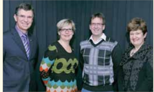
Le programme Premier contact avec la culture professionnelle a été lancé officiellement en novembre dernier. En tout, 47 jumelages entre étudiants étrangers et professionnels ont été créés.

Le programme Premier contact avec la culture professionnelle a été lancé en novembre dernier. Ce projet donnant la chance à des finissants issus de l'immigration d'être jumelés à des professionnels de la région a vu le jour grâce au soutien de la Conférence régionale des élus de la Capitale-Nationale et du ministère de l'Immigration et des Communautés culturelles ainsi qu'à la collaboration du collège François-Xavier Garneau et Accès Travail Portneuf. La première année d'activité du programme a été clôturée le 14 mars dernier lors de l'activité Opération rapprochement qui a réuni 130 étudiants étrangers et employeurs.